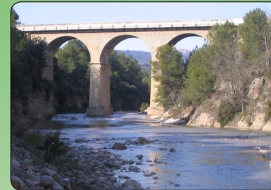
Pont riu Montlleó