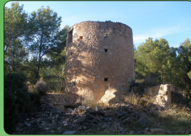
Paratge Molins de vent