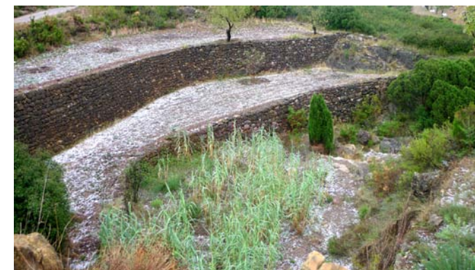
Camps amb granís després d'una forta tronada que va deixar 17 litres l'11 de setembre

A banda aquest any també està sent un dels més secs de l'última dècada. Portem recollits 430 litres quan la mitjana fins desembre és de 570, cosa que significa que tan sols ha plogut una quarta part menys del normal. De fet, en tot l'any, si exceptuem abril i setembre, que vans ser normal i molt plujós respectivament, la resta de mesos han estat molt secs. Per mesos podem destacar que a l'agost va ploure la meitat del que seria normal, mentre que al setembre va ploure el triple de la mitjana ja que es van recollir 221 litres, 103 dels quals en poques hores el 29 de setembre. Però des d'aquell dia, és a dir, en els darrers dos mesos sols hem recollit 17 litres de pluja, quan per mitjana pluviomètrica hauria d'haver estat l'època més plujosa de l'any.