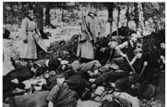
Fotos de camps de concentració