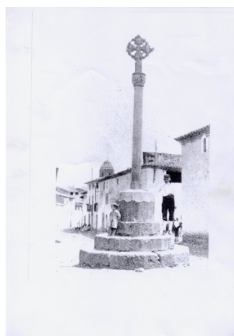
Peiró de Loreto (abans)