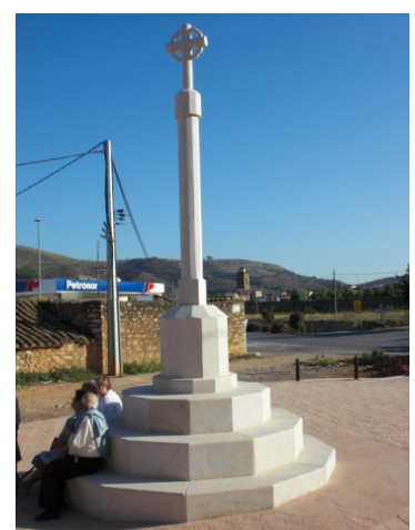
Peiró de la c.Vistabella