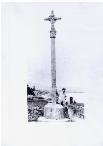
Peiró de la Casilla (abans)