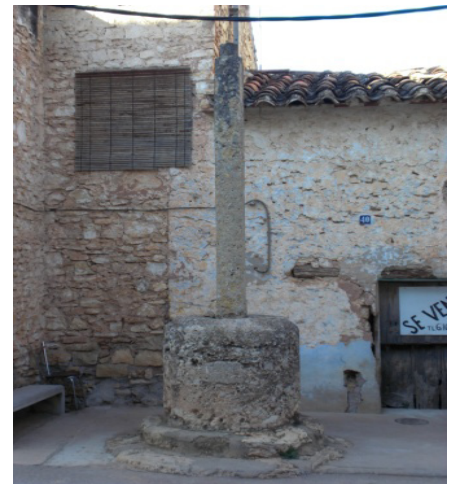
Peiró del c. Xodos (actual)