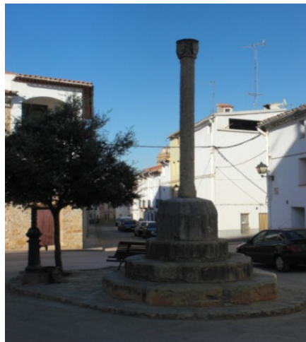
Peiró de Loreto (actual)