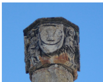
Detall del capitell del Peiró del Loreto d'Atzeneta