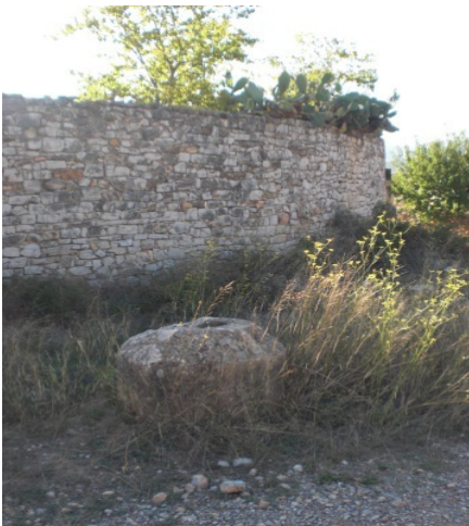
Peiró de la Casilla (actual)

Tal i com podem veure, hi ha fotos dels peirons originals de Loreto i de la Casilla (potser procedeixen de l'Arxiu Mas). Sembla que el peiró de la Casilla era més alt i monumental que els altres dos que ara es conserven.