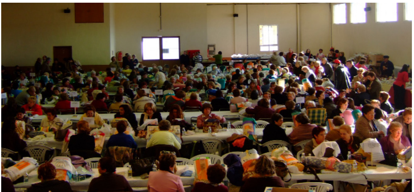
Concentració de puntilleres al local multiusos