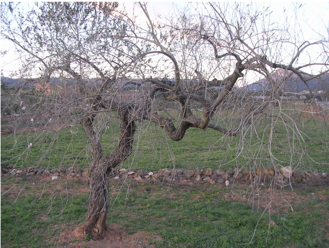
Olivera gelada per culpa de l'intens fred del 17 de novembre de 2007