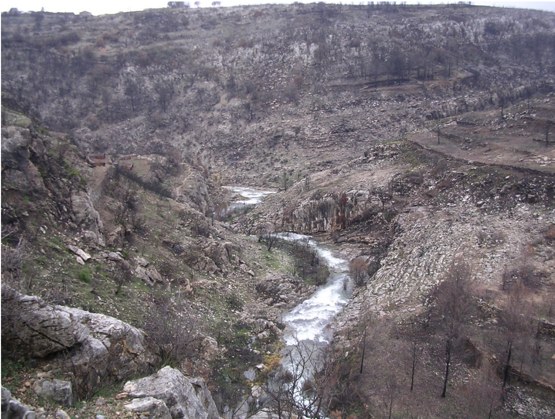
La Rambla del Castell discorre enmig d'un paisatge cremat aquest desembre