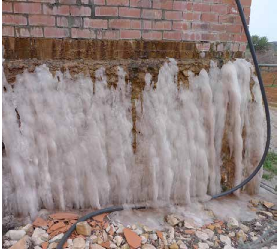
Gel que ix d'un dipòsit en plena onada de fred siberià, febrer de 2012

Com a conclusió, sí que es poden sembrar o fer núvols, però l'èxit sols s'assegura en condicions controlades als laboratoris. A la realitat, els factors que influeixen en l'atmosfera són tan diversos i difícils de controlar que en la majoria dels casos la sembra de núvols no funciona, i quan diuen que han fet augmentar la pluja en un 10% no es pot demostrar si ha sigut degut a la sembra o a variacions climàtiques naturals, ja que tots sabem que hi ha anys més plujosos que altres. Per tant, segurament les avionetes que veiem que volen durant l'estiu no són sembradores de núvols perquè el cost d'aquesta tècnica és molt elevat i la probabilitat de funcionar prou baixa; i en tot cas, si foren avionetes sembradores de núvols seria per fer ploure més, mai per desfer els núvols.