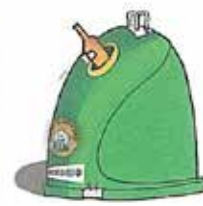
Contenidor verd: sols residus d'envasos de vidre, com botelles i pots de vidre.