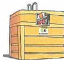
Contenidor groc: sols residus d'envasos de plàstic, llaunes i brics.

separant els envasos a casa actives la cadena del reciclatge.