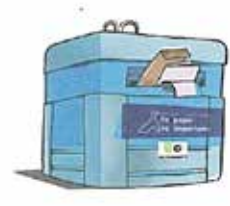
Contenidor blau: sols residus d'envasos de cartó, paper, periòdics i revistes.

La cadena de reciclatge comença quan els consumidors separen els envasos dels productes de la resta de les escombraries i els dipositen en els diferents contenidors. Hi ha cinc tipus de contenidors de reciclatge, amb diferents colors, encara que al poble només podrem trobar els tres següents: