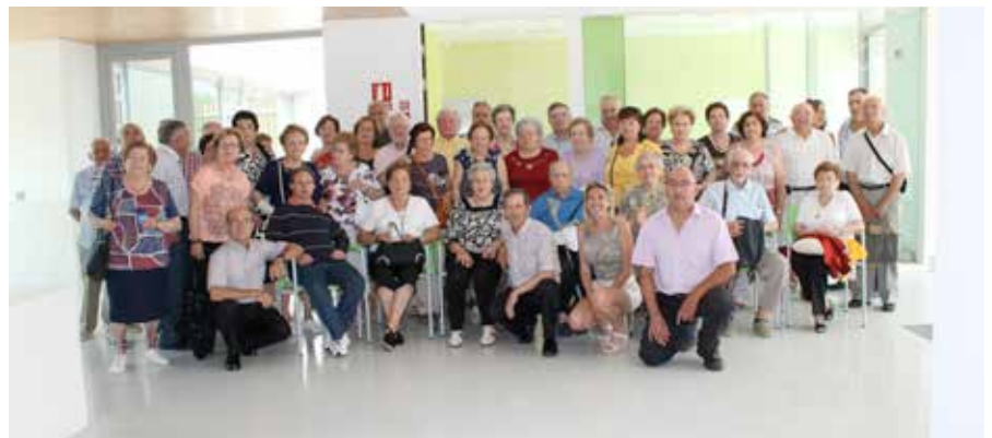
Visita dels Jubilats d'Aín al poble d'Atzeneta.

En el seu moment es va signar un conveni entre l'Excma. Diputació, els alcaldes dels respectius Ajuntaments i els