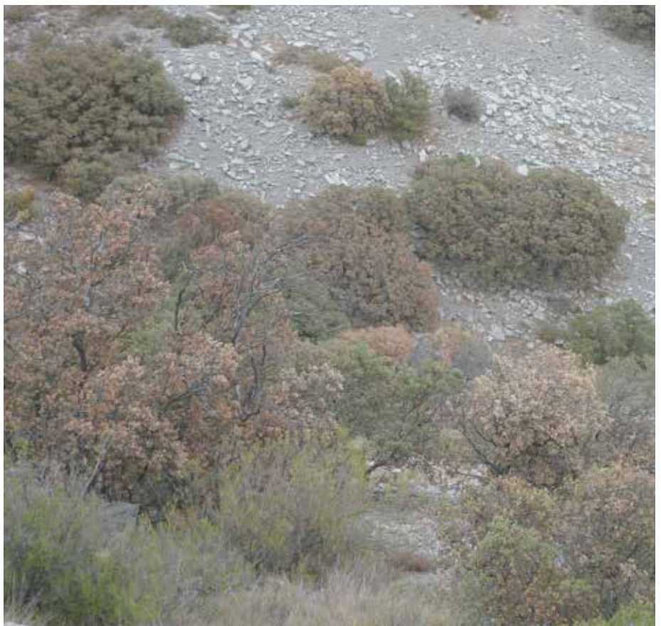
Algunes carrasques es van assecar el passat estiu