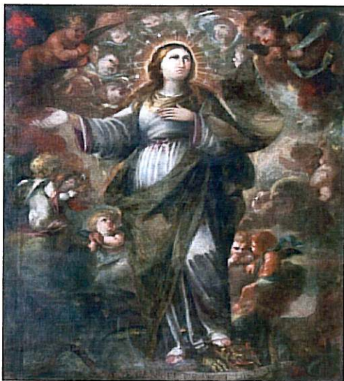
La Immaculada. Pintura a l'oli sobre llenç, pertanyent a l'Ajuntament d'Atzeneta datada el dia 25 juny 1689 per FRANCES AIS DE GABRIEL.